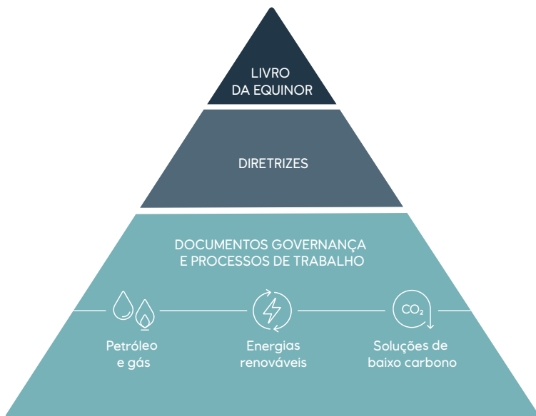
A estrutura do sistema de gestão da Equinor